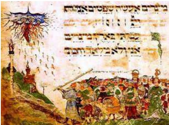
Esodo dall'Egitto con Mosè

Nell'Antico Testamento viene chiamata la Pasqua del Signore, la Pasqua del popolo.