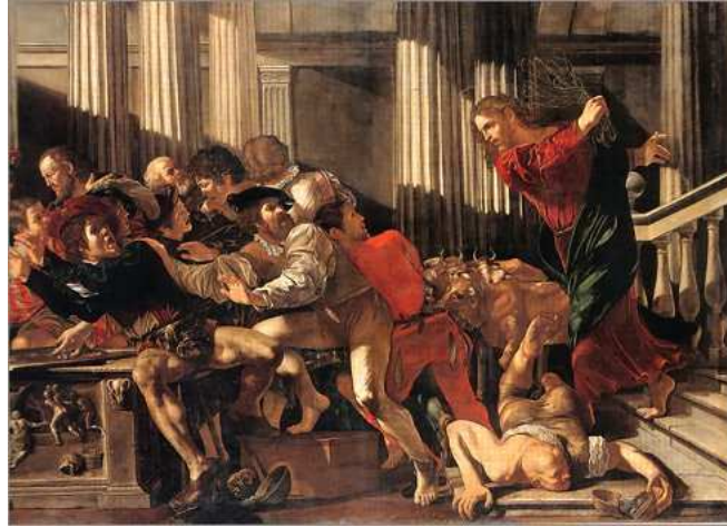
La cacciata dei mercanti dal tempio- Cecco del Caravaggio

Ci sono i Comandamenti di Mosè e i Comandamenti di Gesù, che sono infiniti, perché il Comandamento dell'Amore si diversifica in tutte le occasioni di bene, che abbiamo nella nostra vita. Anche tutte le possibilità che abbiamo di evitare il male diventano un Comandamento. Questo ci libera dall'angoscia che la religione provoca.